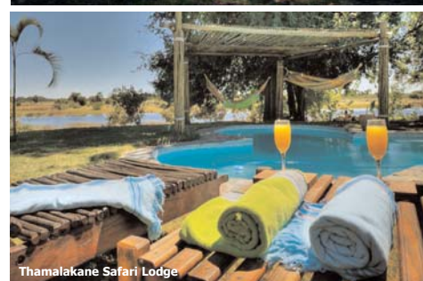
Thamalakane Safari Lodge