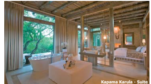
Kapama Karula - Suite

Am frühen Morgen Transfer zum Flughafen und Rückflug nach Frankfurt/München im interessanten Tagesflug.