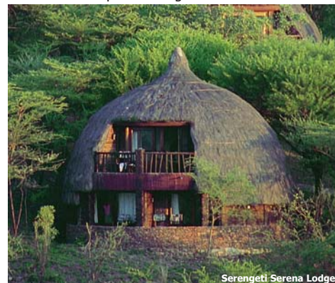
Serengeti Serena Lodge

15. Tag: Rückkunft Deutschland Ankunft in Europa am Morgen.