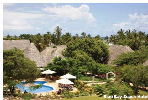
Blue Bay Beach Hotel