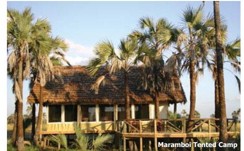
Maramboi Tented Camp