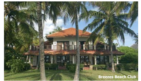
Breezes Beach Club

Reisetermine englischsprachig: jeden Samstag und Dienstag