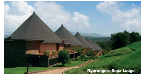
Ngorongoro Sopa Lodge

HINWEIS: Die Safari kann in umgekehrter Reihenfolge bei gleicher Leistung durchgeführt werden