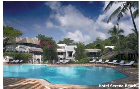
Hotel Serena Beach