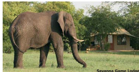
Savanna Game Lodge